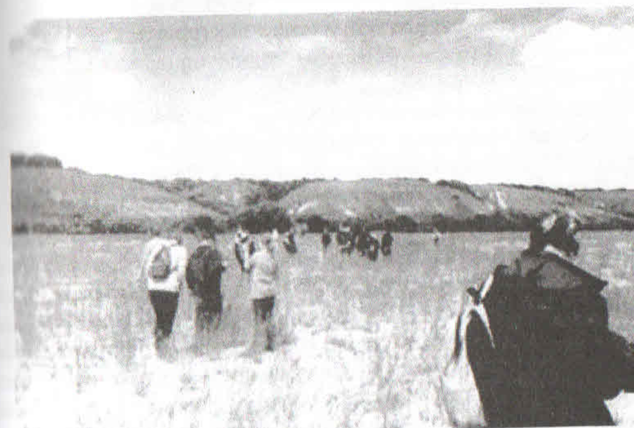
Археологическая разведка на берегу реки Толучеевки

Среднеикорецкие учащиеся, да и другие тоже, старались ни в чем не уступать другим. Результаты этих соревнований оценивались