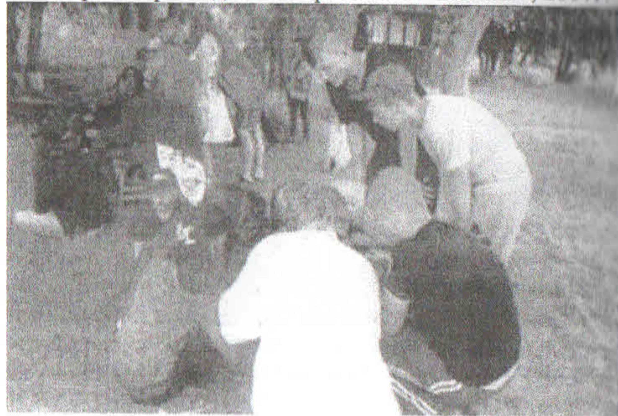
Историко-краеведческая викторина. Команда «Динамит» МКОУ «Среднеикорецкая СОШ».

грамотами и призами. Ни одна из команд не осталась без наград и призов, в том числе и Среднеикорецкая школа. В ее активе различные буклеты, магниты, сувениры, а также грамоты за первое место в конкурсе плакатов, посвященных Дню России, за 3-е место в экологической викторине, атаманская грамота войскового канцелярия общества «Всевеликое Войско Донское», атаманская грамота (1-е место) за прохождение полосы препятствий, грамота за активное участие в историко-краеведческом фестивале «Истоки», 2017г.