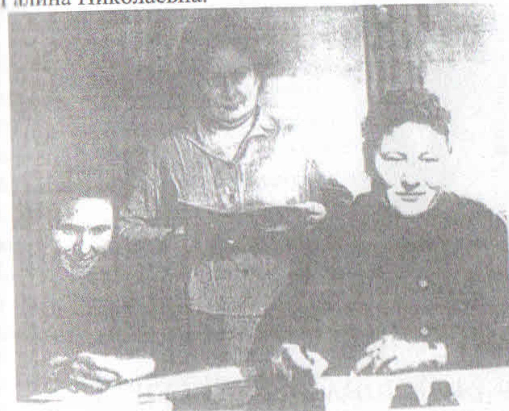
Снимок 1973 года.